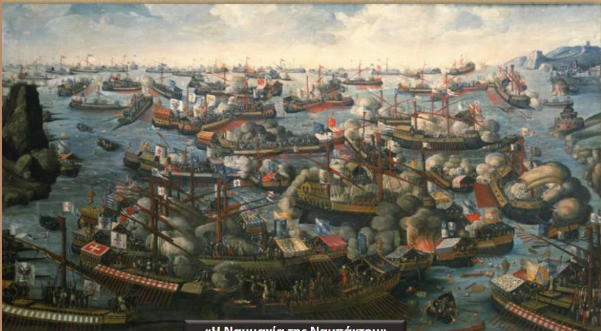
«Η Ναυμαχία της Ναυπάκτου»