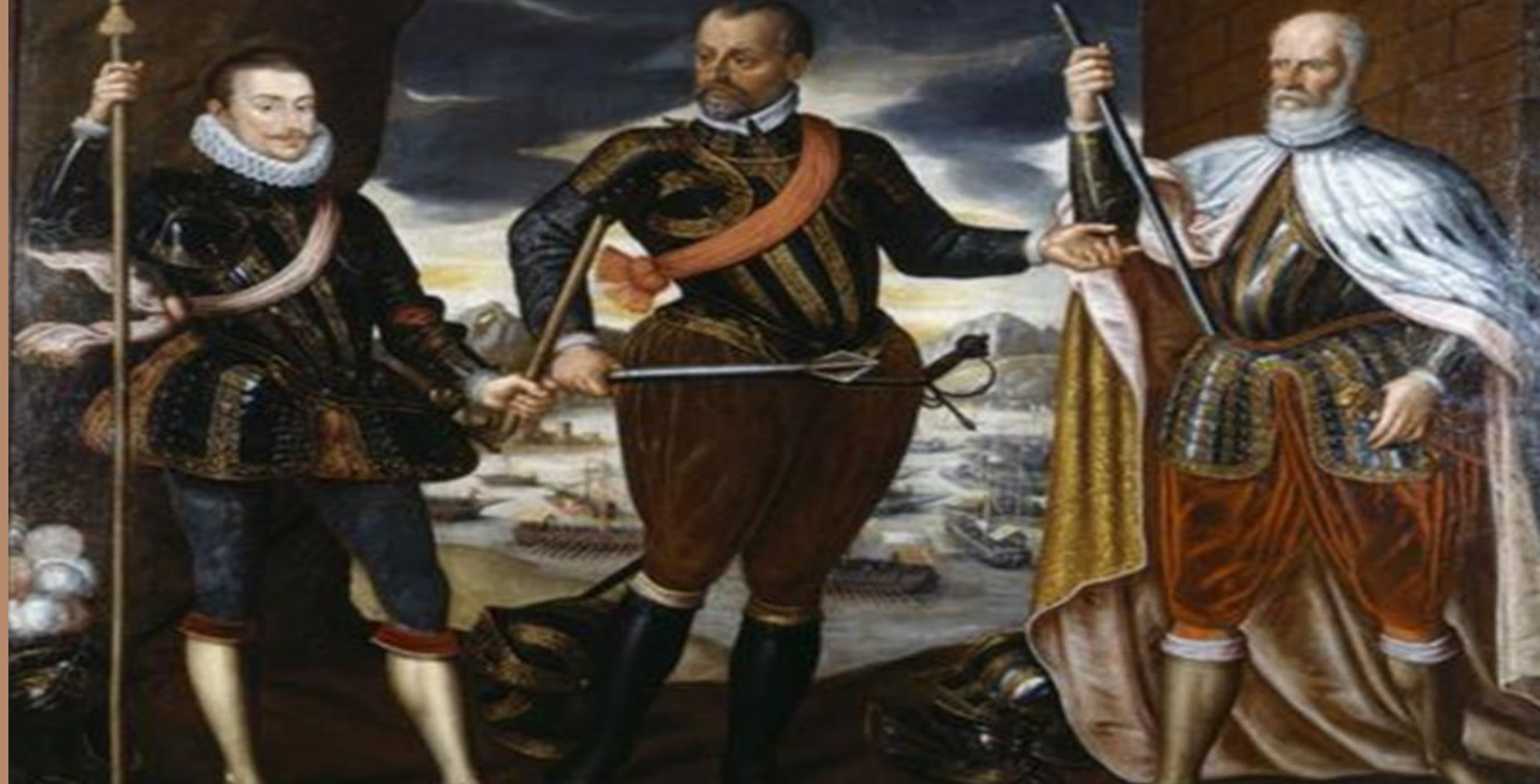
Αρχηγοί του Ενωμένου Χριστιανικού Στόλου, Δον Ζουάν ο Αυστριακός, Μαρκαντόνιο Κολόννα, ο Σεμπαστιάνο Βενιέρ.